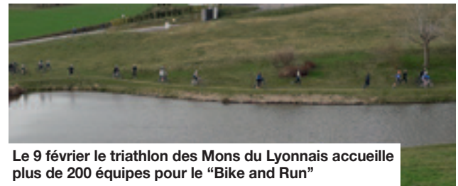
Le 9 février le triathlon des Mons du Lyonnais accueille plus de 200 équipes pour le "Bike and Run"