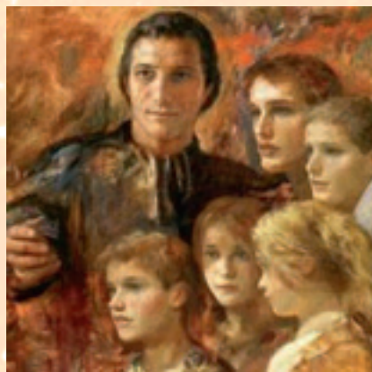
Saint Marcellin Champagnat

Le musée de l'Océanie et l'espace Colin, dans les locaux de la Neylière, méritent d'être visités..