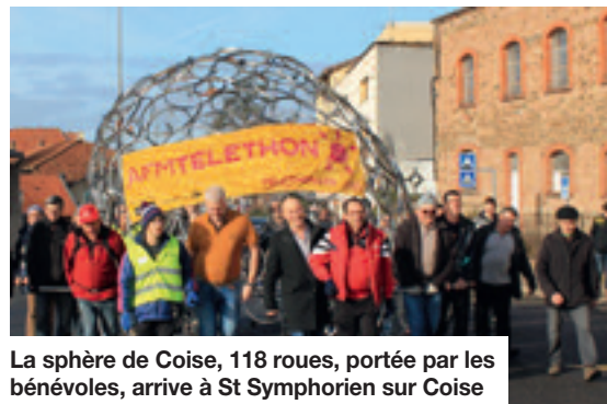
La sphère de Coise, 118 roues, portée par les bénévoles, arrive à St Symphorien sur Coise