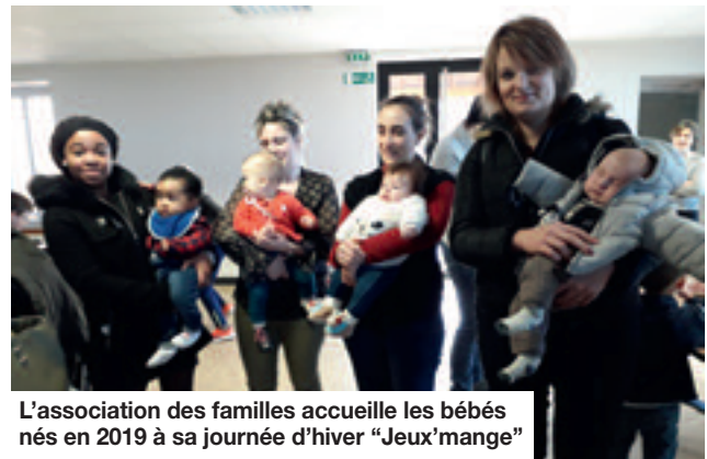
L'association des familles accueille les bébés nés en 2019 à sa journée d'hiver "Jeu'mange"