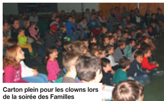
Carton plein pour les clowns lors de la soirée des Familles