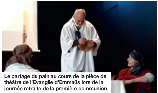
Le partage du pain au cours de la pièce de théâtre de l'Evangile d'Emmaüs lors de la journée retraite de la première communion