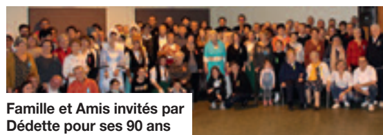
Famille et Amis invités par Dédette pour ses 90 ans