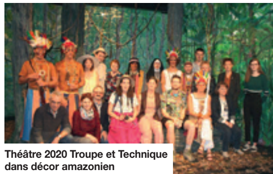
Théâtre 2020 Troupe et Technique dans décor amazonien